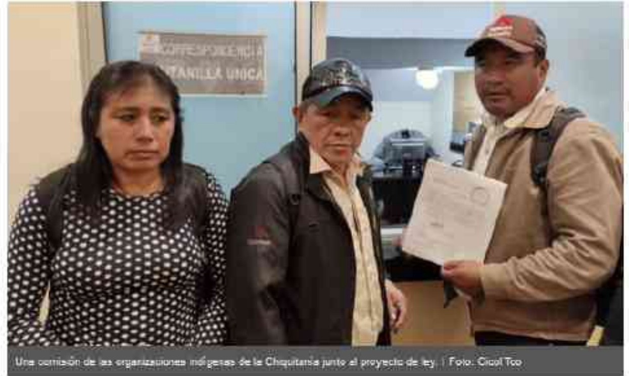
Una comisión de las organizaciones indígenas de la Chiquitanía junto al proyecto de ley.